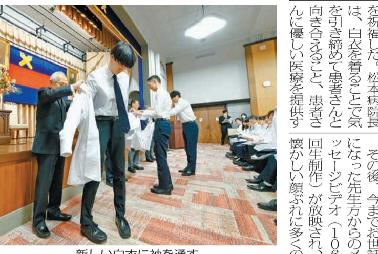
新しい白衣に袖を通す