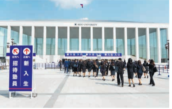
晴天に恵まれた日吉記念館

令和3年4月1日に慶應義塾大学入学式が吉野記念館で行われた。新入生は、医学部110名、薬学部102名、理学部18名、経済学部18名、環境情報学部18名、総合政策学部18名、看護医療学部18名、計304名が入学した。