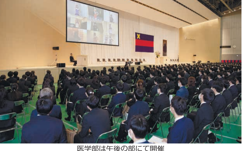
医学部は午後の部にて開催