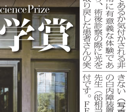
インドネシアリウマチ専門医来日の様子