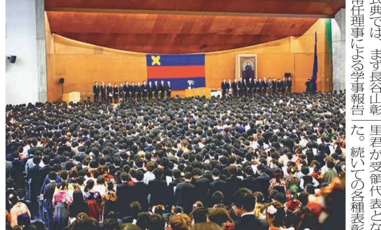
日吉記念館での卒業式

平成28年度卒業式が3月28日(日)記念館で行われた。卒業生107名が社会へと羽ばたく。卒業式は午前10時開始に開始された。