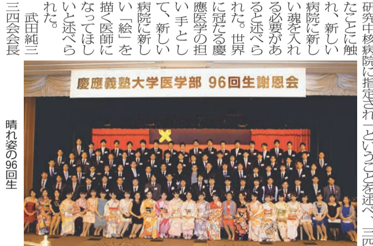
平成28年度卒業生 96回生謝恩会