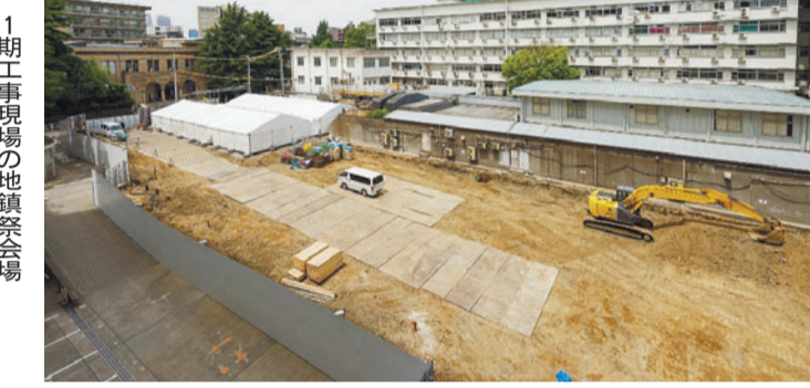
1期工事現場の地鎮祭会場

2012年秋の義塾理事会と評議員会において1号館建設プロジェクトが承認され、2013年9月には設計施工を担う竹中工務店の間に契約が結ばれました。