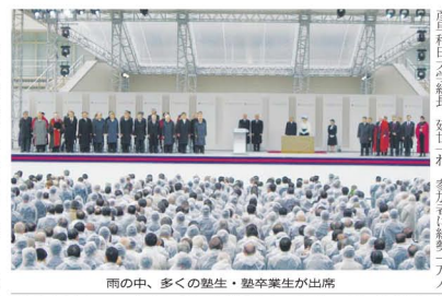
雨の中、多くの聴生・塾卒業生が出席

「塾生は『独立自尊』の精神を備えた未来への先導者。慶應義塾は『未来への先導』を基本テーマに掲げ、グローバル時代に開かれた学塾として、創立百五十年記念事業を遂行している」(安西塾長)