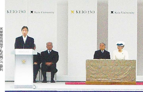
天皇后両陛下の御親臨を仰ぎ、総勢一万人を超える参加者のもと盛大に開催

「塾生は『独立自尊』の精神を備えた未来への先導者。慶應義塾は『未来への先導』を基本テーマに掲げ、グローバル時代に開かれた学塾として、創立百五十年記念事業を遂行している」(安西塾長)