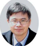
生理学教授 岡野 栄之 (62回)